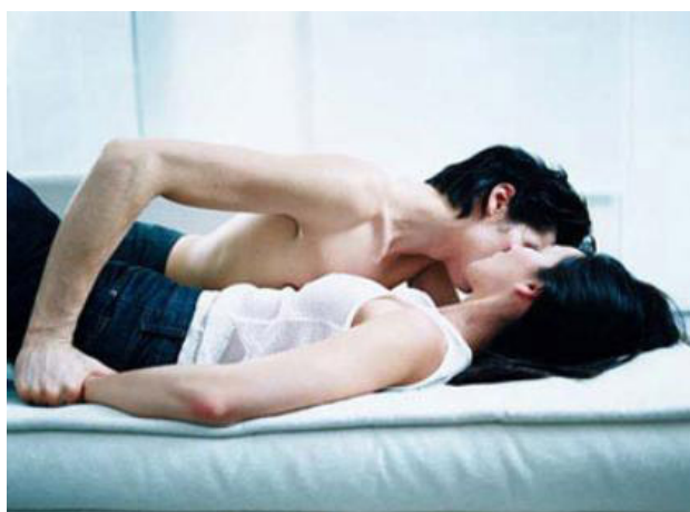
Đừng để tình dục là điều kiện cho tình yêu