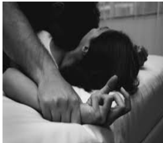
Bạo lực cần bị loại bỏ khỏi tình dục...

ấy đã khiến cho Lan buông xuôi: “Thôi chiều một lần cho xong”. Nhưng