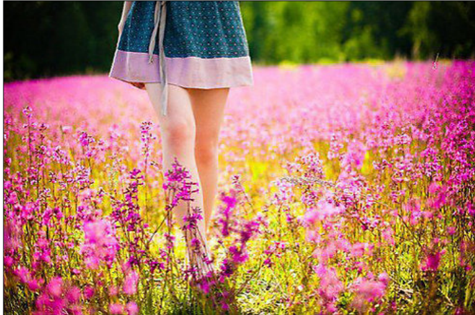
Cuộc sống là tất cả những gam màu khác nhau

Có những lần tình cờ gặp nhau đơn giản chỉ biết mặt nhau hay thậm chí chẳng để ý tới, nhưng nhờ có nó ta chợt nhận ra: vô tình gặp nhau ba lần đó là nhân duyên.