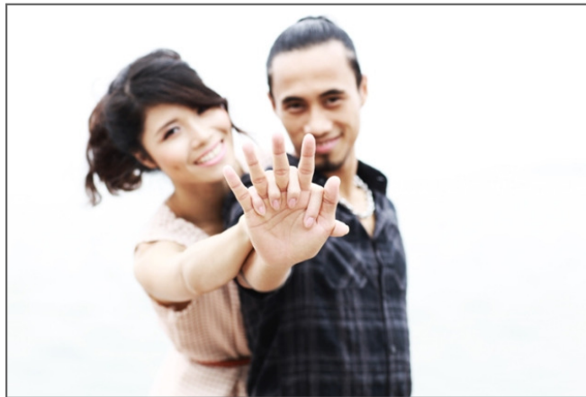
Người đàn ông đích thực là người dám lên án quấy rối và làm dụng tình dục kể cả khi người đó là bạn của mình

Chứng kiến cái cau mày khó chịu của Tâm, Thành nhắc nhở Minh ngay khi hai người về phòng. Thay vì cảm ơn bạn và rút kinh nghiệm, Minh lại tỏ ra tức giận: “Ông thôi đi, các nàng ấy có ý kiến gì đâu mà ông cứ nhiều chuyện”. Đúng là chưa có cô bạn cùng xóm trọ nào nói gì với Minh, nhưng bắt đầu từ