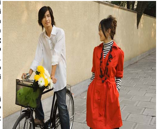
Khi mới quen cô ấy rất quan tâm...

Thực tế, có những mối quan hệ có thể phát triển thành tình yêu và tình yêu ấy rất bền vững, rất sâu sắc khi được xuất phát từ những thiện cảm ban đầu. Tuy nhiên cũng có rất nhiều người có thiện cảm ban đầu với nhau nhưng sau đó thiện cảm ấy lại biến mất vì một số lý do nhất định hoặc chẳng vì một lý do gì cả.