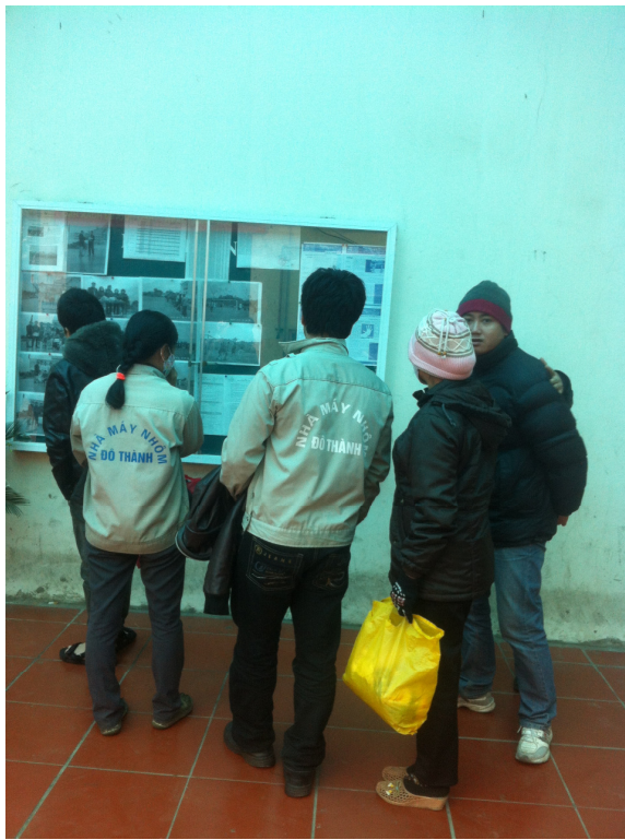
Chuyên san Nhịp sống trẻ thu hút sự quan tâm của CBCNV

Phương Liên – Mai Lan (CTCP Nhóm Đô Thành)