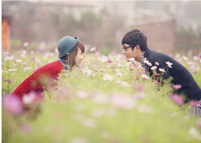
Sự chân thành, mạnh dạn và một chút sáng tạo là đủ để bạn giữ lửa yêu thương

Như ai đó đã nói: thời gian như cơn gió, sẽ thổi bùng ngọn lửa mạnh và dập tắt ngọn lửa yếu. Thế nên, để lửa tình yêu luôn cháy mãi, hãy tiếp cho nó thêm sức mạnh bằng sự quan tâm, lắng nghe và chia sẻ với nhau. Chỉ có như vậy, khi gặp thử thách, bạn mới có sức mạnh để bạn vượt qua khó khăn.