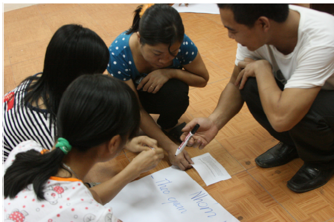
Những buổi truyền thông của CCIHP đã giúp cuộc sống vợ chồng tôi thay đổi