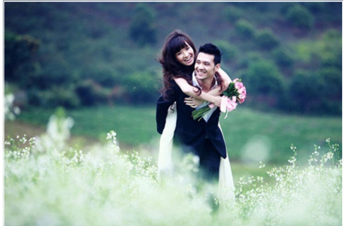
Ngon lửa tình yêu giúp chúng ta vượt qua thử thách

trọ gần khu nhà anh, hầu như ngày nào cũng thế, không đầu giờ sáng thì cuối giờ chiều, Xuyến quét dọn sạch sẽ cái sân nhỏ trong khu trọ và phía trước cổng ngoài. Thực ra anh chỉ nhìn thấy cô một cách rất vô thức, nhưng chẳng hiểu sao, có giai đoạn anh thấy cứ thiếu thiếu cái gì đó. Hóa ra, hình bóng quen quen của cô gái bé nhỏ vẫn quét