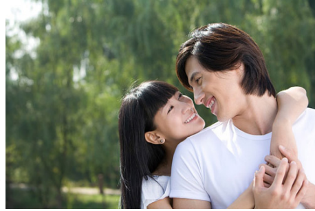
Chữ X thứ ba có thể là một chủ đề thú vị

Với một đất nước chịu nhiều ảnh hưởng của nền văn hóa Á Đông thì tình dục luôn là một đề tài hết sức tế nhị, đó cũng là lý do khiến phần lớn các cặp đôi cảm thấy ngại ngùng khi đề cập đến “chuyện ấy”. Tuy nhiên, những quyết định về tình dục có liên quan đến cả hai người trong cuộc vì vậy nó đòi hỏi những người yêu nhau có kỹ năng giao tiếp tốt với nhau. Hãy chú ý đến những yếu tố dưới đây để cuộc trò chuyện về vấn đề nhạy cảm của bạn và người ấy trở nên thú vị và hiệu quả.