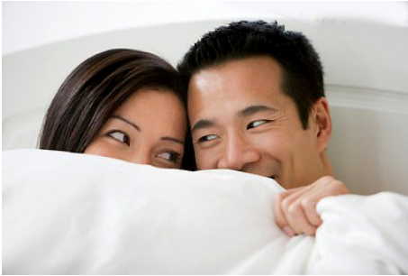
Sự chuẩn bị kỹ càng không bao giờ là thừa khi khởi đầu "chuyện ấy"

tình dục có liên quan đến những nguy cơ sau đó: Mang thai ngoài ý muốn, nhiễm bệnh lây truyền qua đường tình dục và cả nguy cơ thay đổi mối quan hệ giữa hai người. Liệu bạn có sẵn sàng đối mặt? Nếu bạn chưa hình