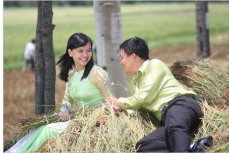
Một không gian phù hợp giúp bạn tự tin hơn

cố ngớ ngẩn đó mình đã lên kế hoạch sẽ trao đổi với bạn trai về quan điểm của mình trong tình dục đó là “chuyện ấy” chỉ diễn ra khi mình sẵn sàng và thuyết phục bạn trai ủng hộ mình thực hiện mong muốn này. Hôm đó là cuối tuần, bạn trai đến phòng mình ăn cơm và cả hai cùng xem một bộ phim tâm lý tình cảm lãng mạn. Trong phim có một cảnh sex mặn nồng của hai nhân vật chính khiến mình nghĩ rằng đây sẽ là cơ hội thuận lợi để mình mở đầu về câu chuyện rất khó nói này. Khi mình vừa mới bắt đầu, mặc dù đã chuẩn bị trước nhưng mình vẫn thấy rất bối rối và thẹn thùng, bạn trai mình tỏ ra như rất hiểu ý của mình, anh ấy lao về phía mình hôn tới tấp và bắt đầu có những hành động đi quá xa. Mình đã phải rất vất vả mới vùng vẫy khỏi vòng tay cuồng nhiệt của bạn trai, ngay lập tức mình đã phải hét lên và yêu cầu anh ấy dừng lại. Bạn trai mình ngơ ngác: “Không phải em đang bật đèn xanh cho anh sao?”. Hóa ra là anh chàng đã bắt nhầm tín hiệu và mình đã phải dành thêm thời gian để giải thích về ý định của mình.