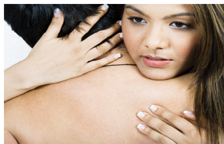
Không phải “chuyện ấy” suôn sẻ là đã quan hệ tình dục

chưa cũng không ảnh hưởng gì đến tình yêu mà họ dành cho người đó. Còn bạn, nếu vẫn trăn trở về việc anh ấy