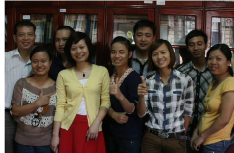
Nhóm công nhân nông cốt xây dựng chuyên san

ngay từ đầu tám thanh niên công nhân nông