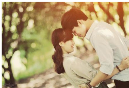
Anh như một món quà dành cho tôi

Khi anh đến tôi cảm thấy anh là một món quà mà ông trời ban tặng. Anh là mối tình đầu của tôi và tôi đã yêu anh rất nhiều, mặc dù thời gian chúng