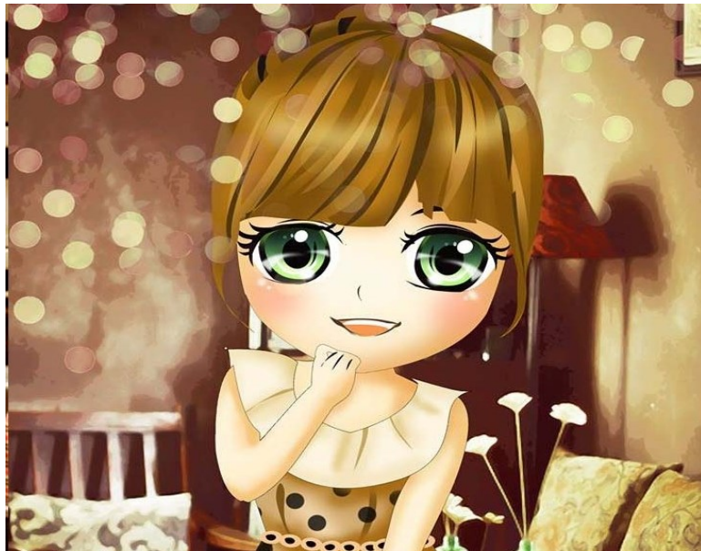
Kinh nguyệt đâu có đáng ghét

- Con không được phán xét linh tinh và còn phải tự hào về điều đó.