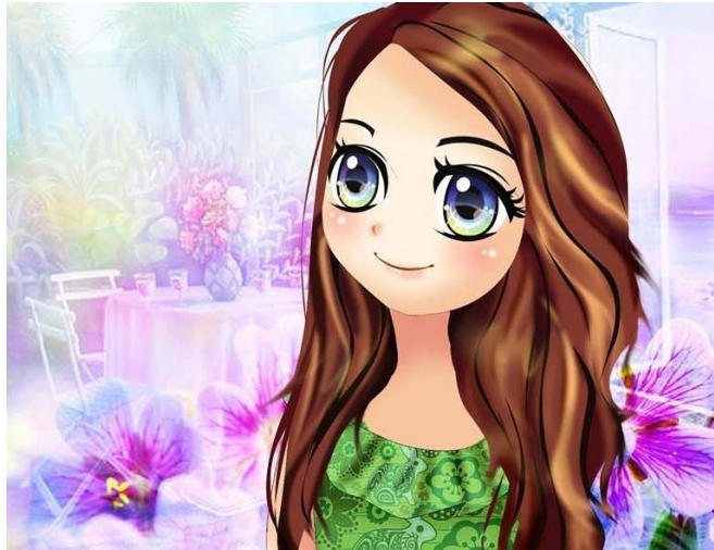
Mẹ rất quan trọng với con