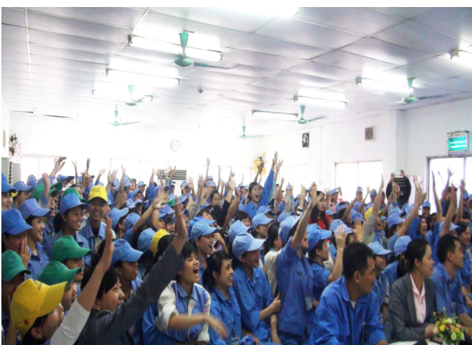
Thanh niên công nhân công ty Suncall hào hứng trong trò chơi “Đi tìm ô chữ bí ẩn”

Những trăn trở đó là một trong các lý do thúc đẩy Trung tâm Sáng kiến Sức khỏe và Dân số (CCIHP) thực hiện chuỗi chương trình truyền thông “Yêu lành