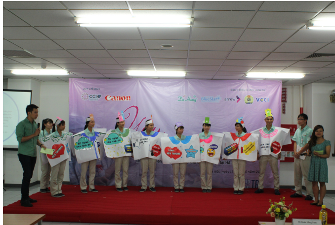
Các đội tham gia trò chơi: “Thời trang và thông điệp”

công nhân thảo luận, giải đáp cho nhau và chuyên gia chỉ đóng vai trò hỗ trợ.