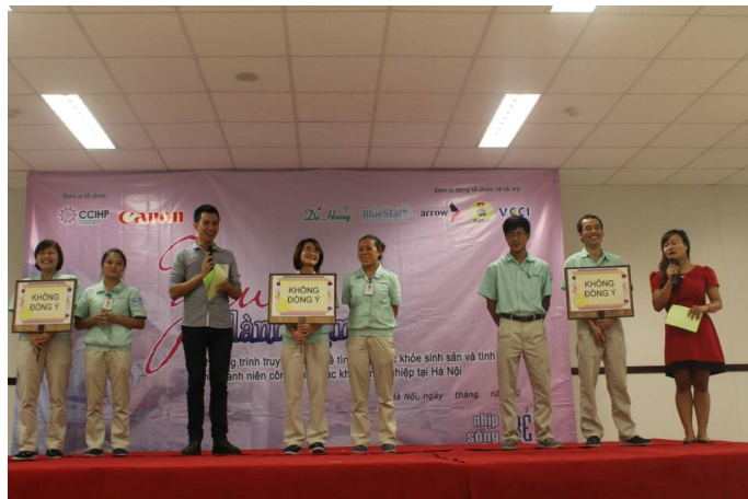
Các đội tham gia trò chơi: “Lựa chọn và biện luận”

Với phương pháp truyền thông tích cực, truyền tải thông tin thông qua các trò chơi tương tác như: Lựa chọn và biện luận, Đi tìm ô chữ bí ẩn, Thời trang và thông điệp hay Làm theo clip, chương trình đã nhận được sự hưởng ứng nhiệt tình của đông đảo thanh niên công nhân. Một bạn nữ công nhân của công ty Suncall Việt Nam hồ hởi chia sẻ: “Mọi người luôn cho rằng đã là con gái phải giữ gìn cho đến ngày cưới, hay con gái mà có quan hệ tình dục trước hôn nhân là hư hỏng. Tuy nhiên, sau buổi hôm nay em có thể nói lại với những người đó rằng dù là gái hay trai việc có quan hệ tình