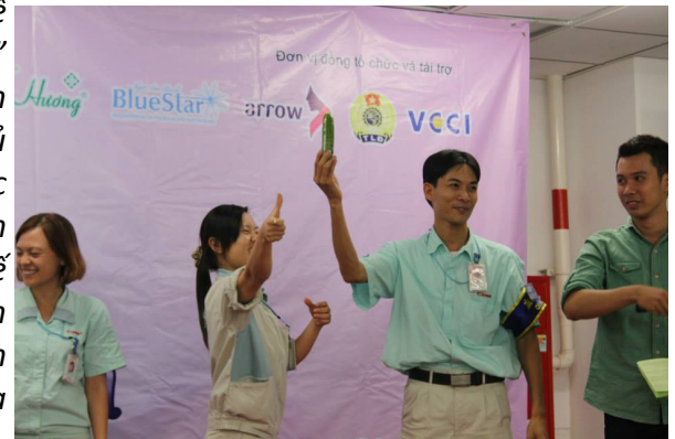
Đội hoàn thành nhanh nhất trong trò chơi: “Làm theo Clip”

Mọi ý kiến đóng góp cho chuyên san và tin bài, xin gửi về email ban biên tập: nhipsongtre@ccihp.org hoặc gửi thư theo địa chỉ của CCIHP