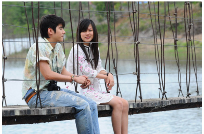
Lần đầu không nhất thiết phải... đau

Mọi điều đã không nằm ngoài những lo ngại của tôi và việc tôi tìm hiểu thông tin về chuyện này không hề lãng phí. Tôi nói với anh: “Em đã rất lo lắng khi thấy mình không giống như lần đầu của nhiều chị em khác, nhưng qua tìm hiểu em biết rằng có điều đó là vì em thực sự yêu anh, thực sự sẵn sàng khi ở bên anh và còn bởi anh đã rất biết cách làm cho em thấy hạnh phúc. Em thấy buồn khi tình yêu của anh dành cho em dễ dàng bị thay đổi chỉ bởi chuyện em có quan hệ tình dục với ai đó trước anh hay không. Nhưng, em vẫn muốn anh tìm hiểu thông tin và dành thời gian để lắng nghe con tim mình, khi nào anh thấy em thực sự có ý nghĩa với anh thì hãy trở lại và nói với em. Em sẵn sàng cho tình yêu của chúng mình thêm một cơ hội nữa”.